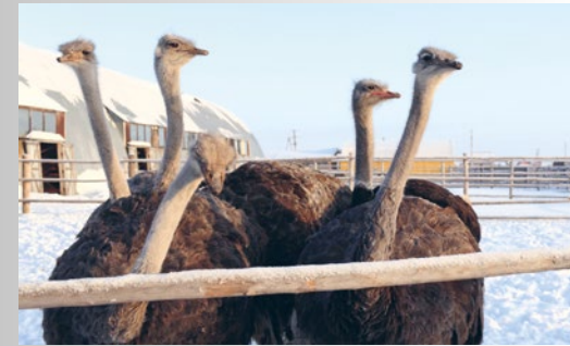
Auch im Winter im Schnee fühlen sich Strausse draussen wohl.

Haltung/Schutz: Wildtierbewilligung, Ausbildung, Gruppenhaltung, viel Platz, Sandbad, während Balzzeit kein Zutritt ins Gehege