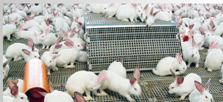
Für diese Mastkaninchen in Grossgruppenhaltung ist Einstreu nicht obligatorisch.

Haltung/Schutz: Einzel- und Gruppenhaltung, Rückzugsmöglichkeiten, hohe Ansprüche an Hygiene und Stallklima, Beschäftigungs- und Nagematerial