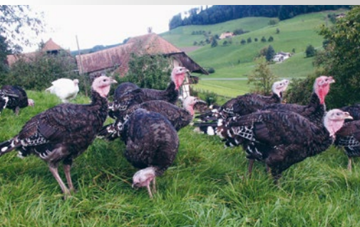
Alle KAGfreiland-Truten geniessen während 2/3 ihrer Lebenszeit Zugang zu einer Weide.

Haltung/Schutz: Gruppenhaltung, erhöhte Sitzgelegenheiten, Einstreu auf 20 Prozent der Stallfläche, hohe Anforderungen an Luftqualität und Temperatur im Stall