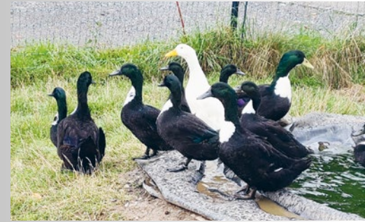
Pommernenten gehören zu den gefährdeten Tieren, die von ProSpecieRara gefördert werden.

Haltung/Schutz: Gruppenhaltung, Bademöglichkeit, Einstreu auf 20 Prozent der Stallfläche