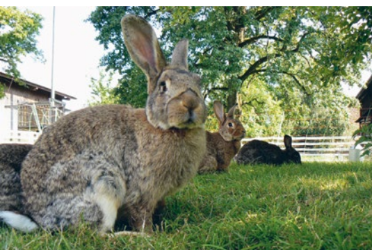
Glückliche Kaninchen dürfen Zugang ins Freie geniessen, im Optimalfall sogar auf einer Wiese.

Vom Tierschutzgesetz vorgeschrieben sind weder erhöhte Flächen noch Einstreu oder die Gruppenhaltung. Das heisst, ein Kaninchen darf einzeln (lediglich mit Sicht- und Geruchkontakt zu Artgenossen) in einem Käfig mit perforiertem Boden ohne Einstreu gehalten werden. Dies ist ganz klar keine artgerechte Haltung. Kaninchen sind soziallebende Tiere, die Bewegung, Kontakt zu Artgenossen, Einstreu als Beschäftigungsmaterial sowie Rückzugsmöglichkeiten brauchen. Kaninchen haben hohe Anforderungen an das Stallklima und sind sehr stressanfällig, deshalb ist eine aufmerksame, zeitaufwändige Betreuung erforderlich.