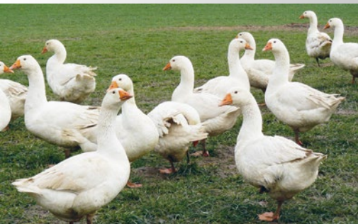
Gänse sind gute Wächter von ihrem Territorium.

Haltung/Schutz: Gruppenhaltung, Bademöglichkeit, Weidehaltung, saisonale Produktion