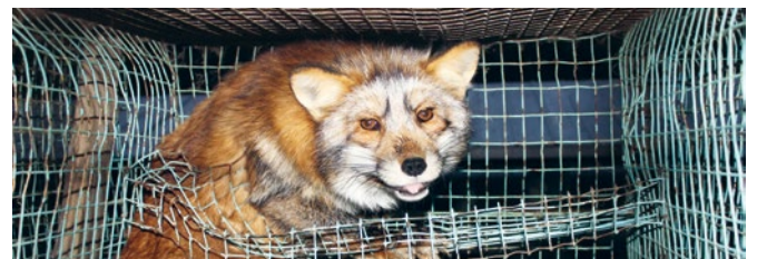
Weil die Menschheit ihren Pelz will, müssen Füchse schrecklich leiden

Neben der Stopfleber-Initiative lanciert Alliance Animal Suisse gleichzeitig die «Pelz-Initiative». Diese fordert ein generelles Einfuhrverbot von Pelz und Pelzprodukten in der Schweiz. Weltweit werden jedes Jahr zirka 100 Millionen Tiere wie Nerze, Füchse, Waschbären und Chinchillas wegen ihres Pelzes getötet. Mehr als die Hälfte der in die Schweiz importierten Pelze stammt aus China, wo die Tiere unter schrecklichsten Bedingungen in kleinen Käfigen gehalten werden. Oftmals werden sie noch bei lebendigem Leib gehäutet.